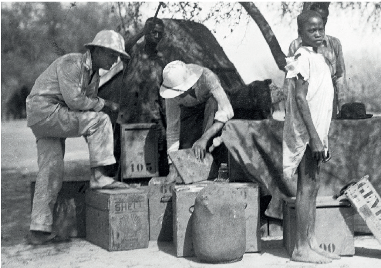
Leiris et Schaeffner au campement de Niamey, fin 1931, tirage sur papier baryté, 12 x 17 cm.

L'exposition du Musée du quai Branly revient sur la célèbre mission Dakar-Djibouti (1931-1933), expédition fondatrice de l'ethnologie française, en soumettant les méthodes de collecte coloniales de l'époque à une relecture critique contemporaine, nourrie par les travaux de chercheurs africains.