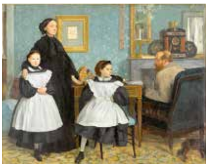
Paris Musée d'Orsay MANET/DEGAS 28 mars > 23 juillet

Colmar Musée Unterlinden Place Unterlinden Silvère Jarrosson : L'œuvre qui va suivre 4 mars > 1 er avril