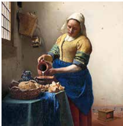
Amsterdam Rijksmuseum VERMEER 10 février > 4 juin

Belvédère Inférieur Rennweg 6 Klimt: Inspired by Van Gogh, Rodin, Matisse... 3 fév. > 29 mai