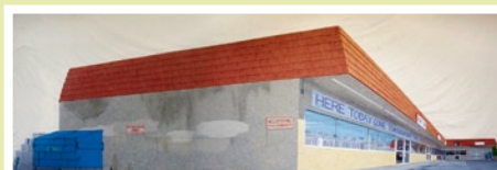
Jim Shaw, Mini-mall , 2008, acrylique sur mousseline, courtesy Galerie Praz Delavallade, Paris.