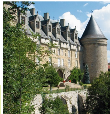
Château de Rochechouart. Le musée départemental qui y est abrité est classé 96°.