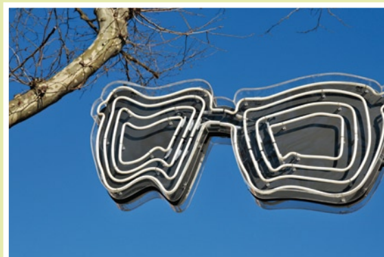
Franck Scurti, Les reflets (opticien) , 2004, exposé aux Abattoirs.