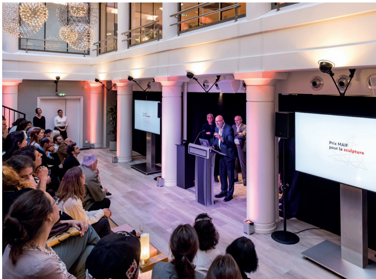
Cérémonie de remise du prix MAIF pour la sculpture 2022.

Si le mécénat culturel semble stagner, le débat n'est pas tranché entre ceux qui pronostiquent une baisse et ceux qui voient un potentiel de développement, notamment de la part des PME. Tous se rejoignent pour prendre acte de la volonté des entreprises de donner davantage sous réserve d'un engagement social et écologique. PAGES 20 À 23