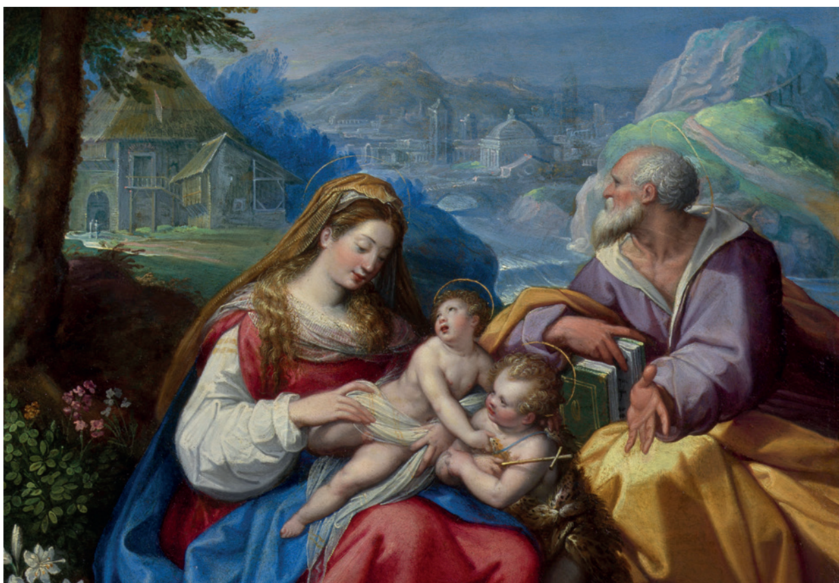
Jacopo Zucchi, Sainte famille avec saint Jean-Baptiste , XVI e siècle, huile sur cuivre, 46 x 37 cm.

Alors que les salons d'antiquaires tendent à disparaître au profit des foires d'art contemporain et que ceux qui restent accordent de plus en plus de place au XX e , Tefaf de Maastricht (11-19 mars) continue à largement accueillir des marchands d'archéologie et des galeries de tableaux et mobiliers anciens.