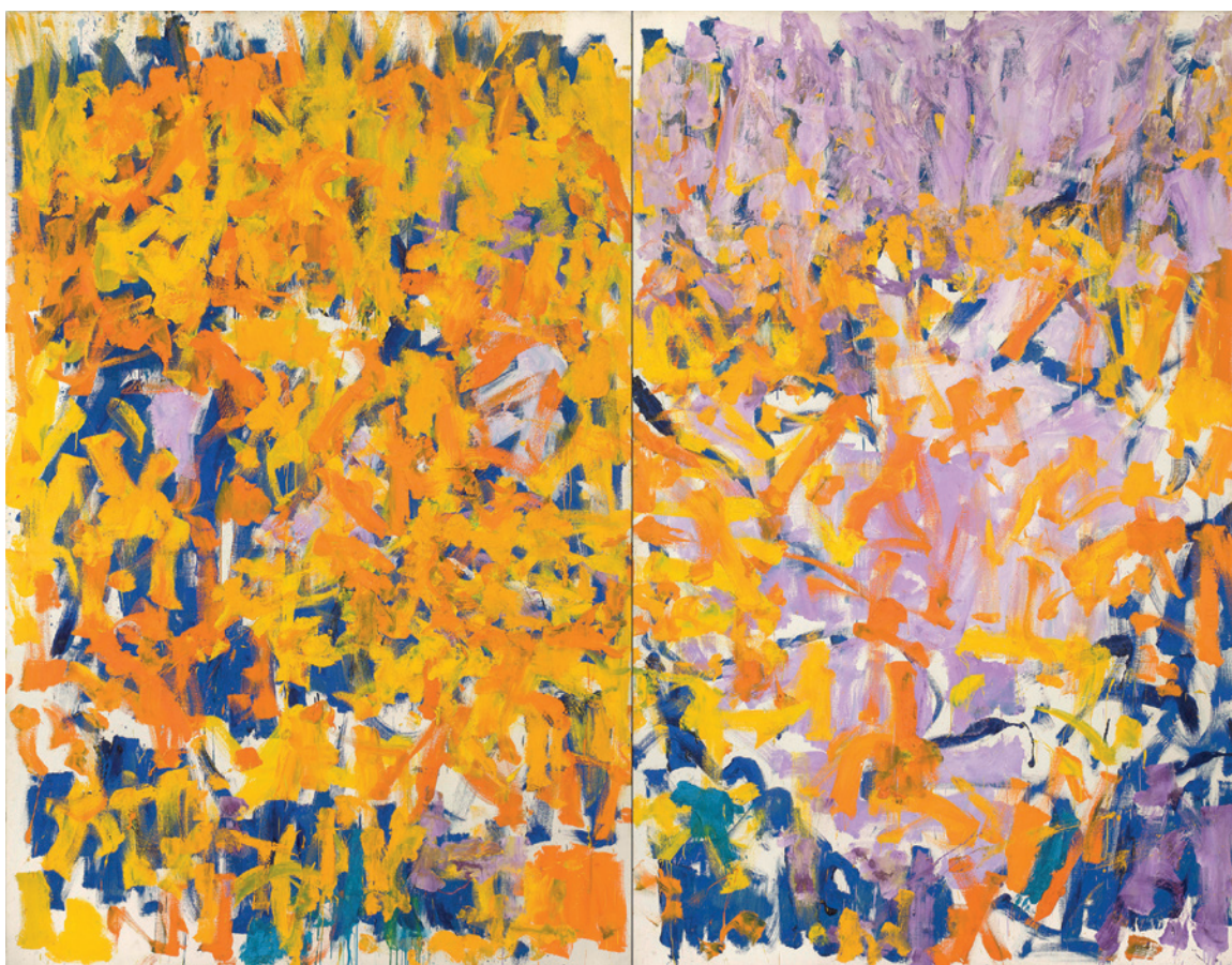
Joan Mitchell, Two Pianos , 1980, huile sur toile, 279 x 360 cm, collection particulière. © The Estate of Joan Mitchell.

La peintre américaine a toujours refusé d'être affiliée au maître de l'impressionnisme. La proximité de l'œuvre de Joan Mitchell (1925-1992) avec le « dernier Monet » est pourtant manifeste, comme le montre l'exposition de la Fondation Louis Vuitton. PAGE 15