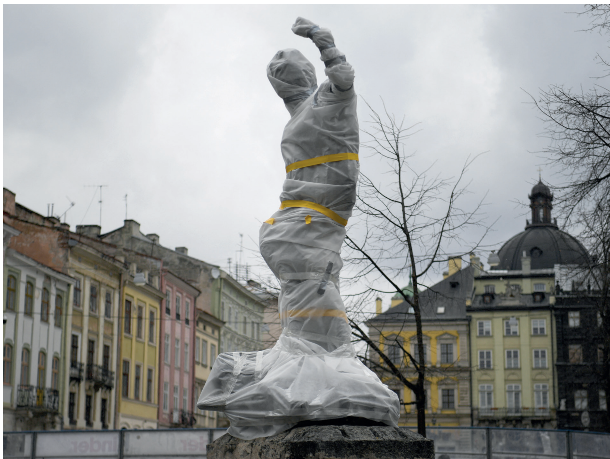
Statue emballée à Lviv, Ukraine, le 5 mars 2022.

Alors qu'en Ukraine les populations civiles sont bombardées par l'artillerie de Vladimir Poutine et que les lieux patrimoniaux sont en danger, les vigoureuses sanctions du camp occidental pèsent de plus en plus sur la société culturelle en Russie. Ailleurs se met en place la solidarité à l'égard des Ukrainiens.