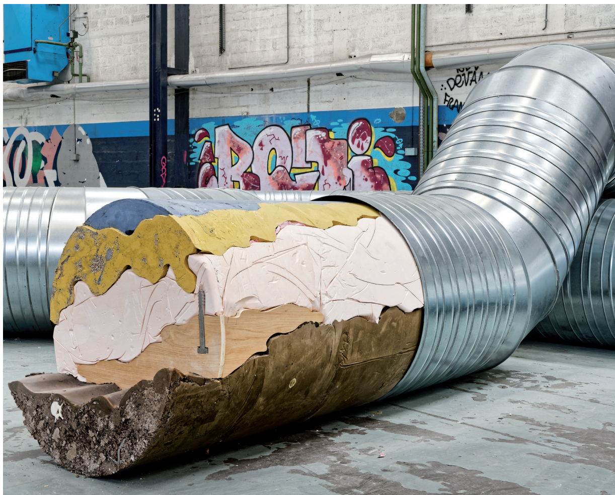
Holly Hendry, Deep Soil Thrombosis , 2019, conduits en acier, plâtre, Jesmonite, bois, techniques mixtes.

La Biennale 2019 est aux antipodes de la foire parisienne. Elle se déroule en région, dans une ancienne usine loin du luxe du Grand Palais et présente un large ensemble d'installations très expérimentales en majorité produites pour la manifestation. PAGES 13 ET 14