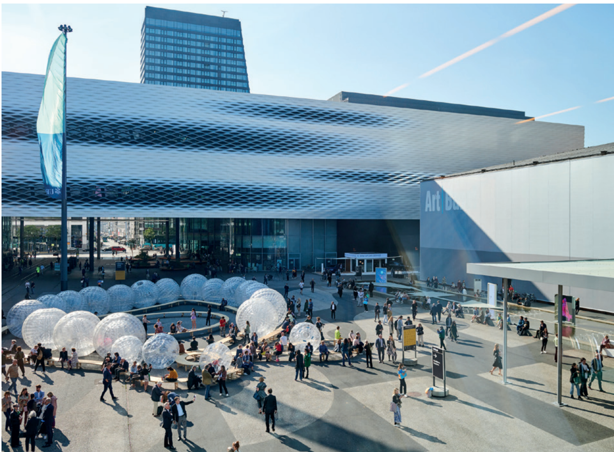
La Messeplatz et le Messe Basel lors de l'édition 2021 d'Art Basel.

L'édition suisse 2023 de la foire d'art contemporain affirme fièrement son statut face à ses boutures à Miami, Hongkong et Paris. Elle se veut universelle et incontournable. Les collectionneurs du monde entier y font un passage obligé. PAGES 31 À 33